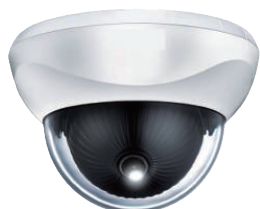
AHD 200万画素ドームカメラ