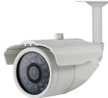
AHD 200万画素赤外線付屋外用カメラ